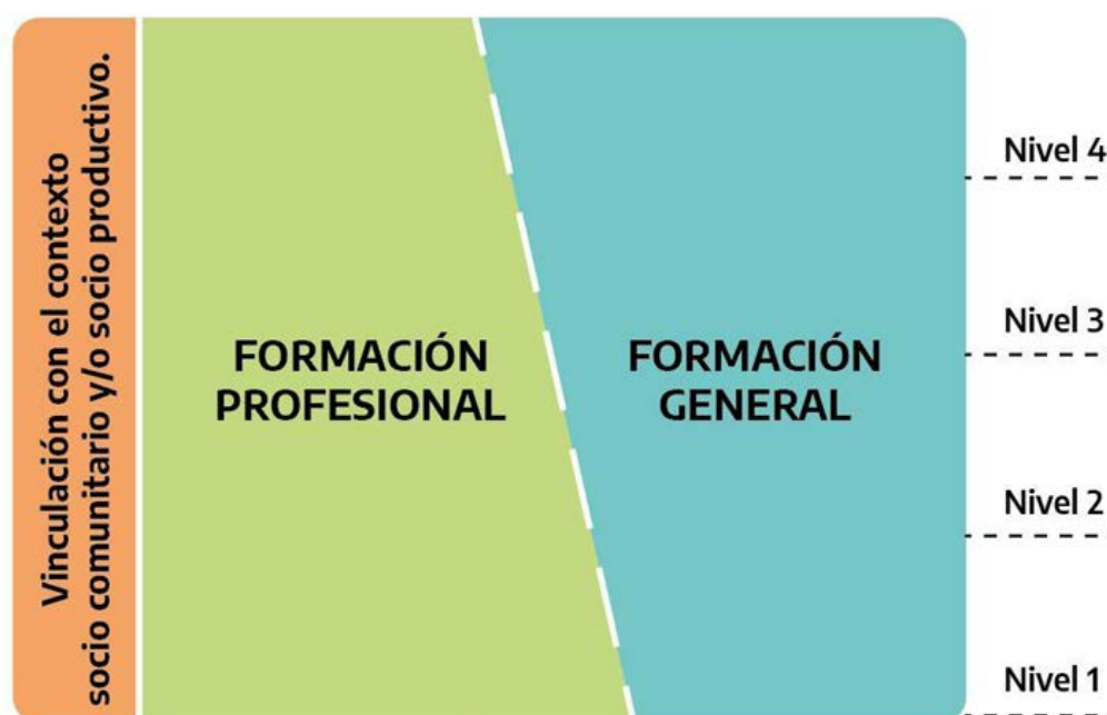
Gráfico N° 1

Siguiendo estos criterios, el diseño curricular se configura de acuerdo con una lógica que procura expresarse en el siguiente gráfico: