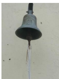
Campana de la EP 1 de Brandsen (igual a la de nuestra búsqueda)