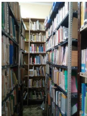
Uno de los pasillos de nuestra biblioteca del Cendie.