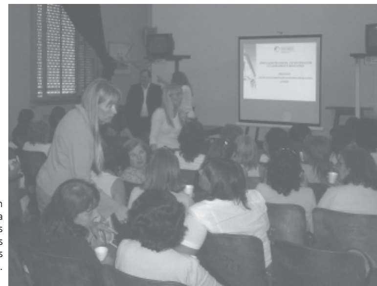
La capacitación es un elemento esencial para afrontar los procesos de cambio en las bibliotecas escolares y especializadas.

Cabe señalar los tópicos que abordará “Series de Estudios y Documentos” son seleccionados